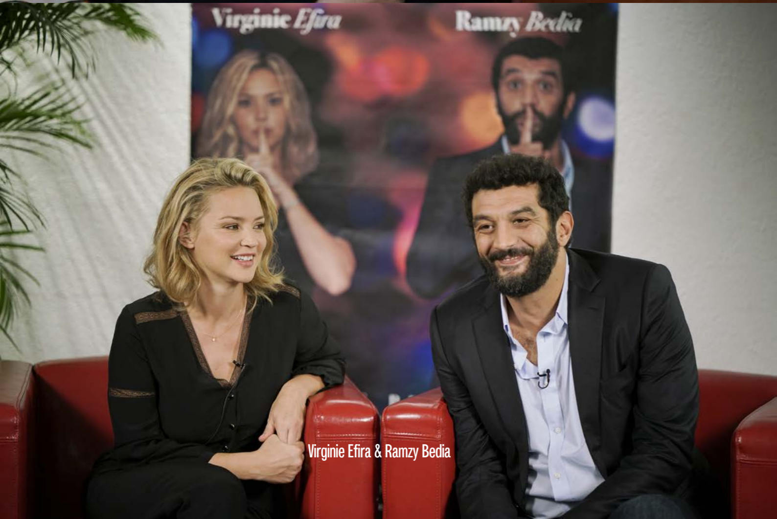
Virginie Efira & Ramzy Bedia